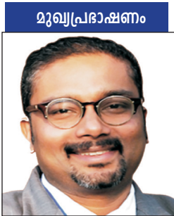
ശ്രീ. എൻ.കെ പ്രേമചന്ദ്രൻ ബഹു. കൊല്ലം എം. പി.